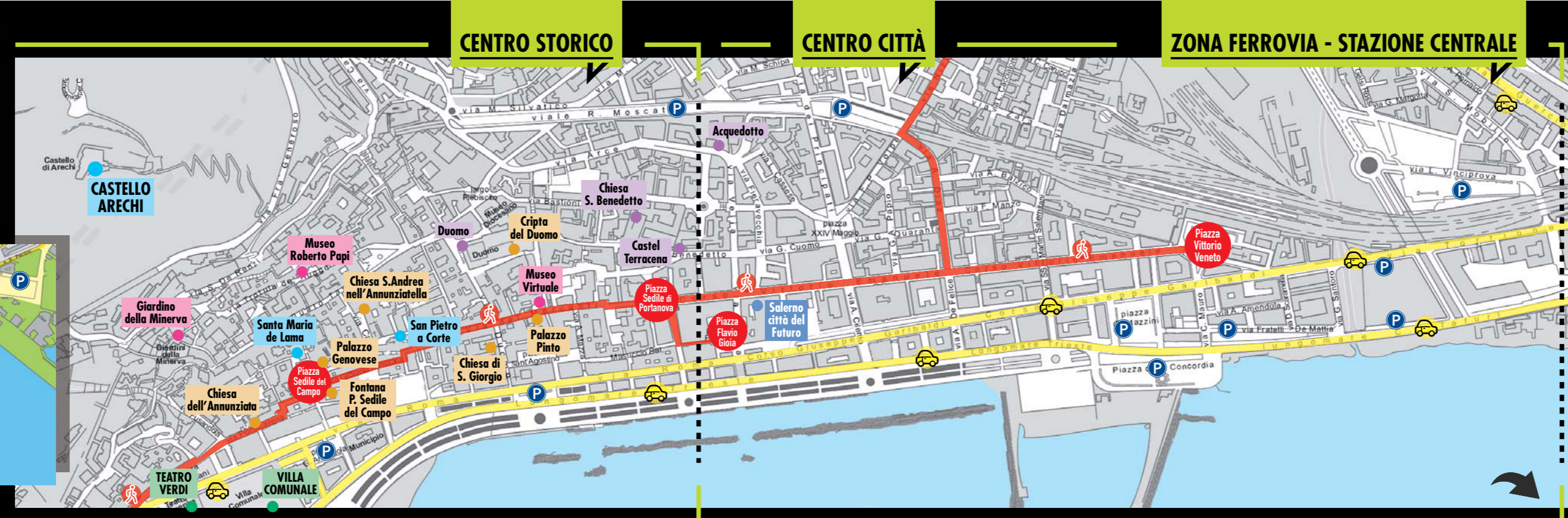
CENTRO STORICO CENTRO CITTÀ